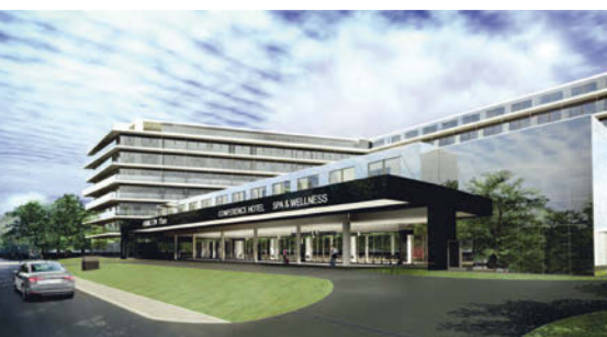
4★ Hotel Hamilton