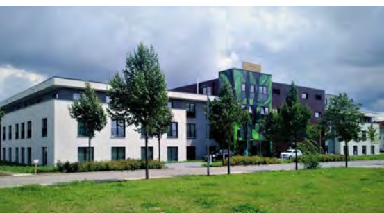
4★ Santé Royale Resort